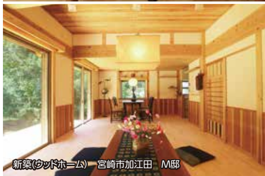
新築(ウッドホーム) 宮崎市加江田 M邸