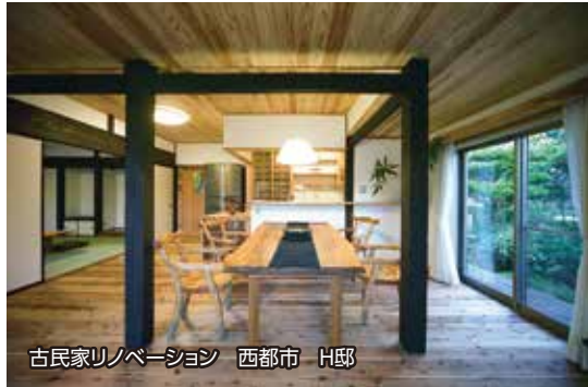
古民家リノベーション 西都市 H邸

木の良さを生かした住まいin学園木花台 8/5 土 ・6 日 10:00～17:00 当社のウッドリノベ・ウッドホーム施工例