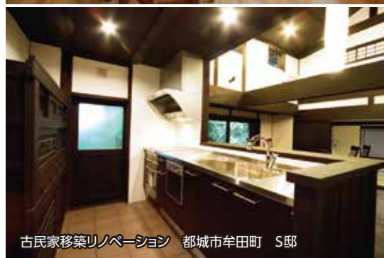
古民家移築リノベーション 都城市牟田町 S邸