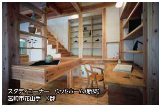
スタディコーナー ウッドホーム(新築) 宮崎市花山手 K邸