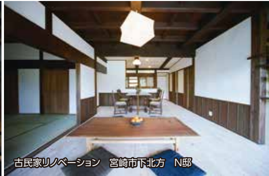
古民家リノベーション 宮崎市下北方 N邸