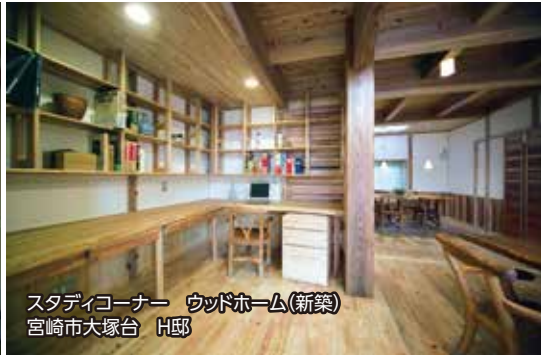
スタディコーナー ウッドホーム(新築) 宮崎市大塚台 H邸