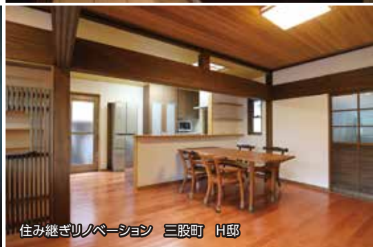
住み継ぎリノベーション 三股町 H邸