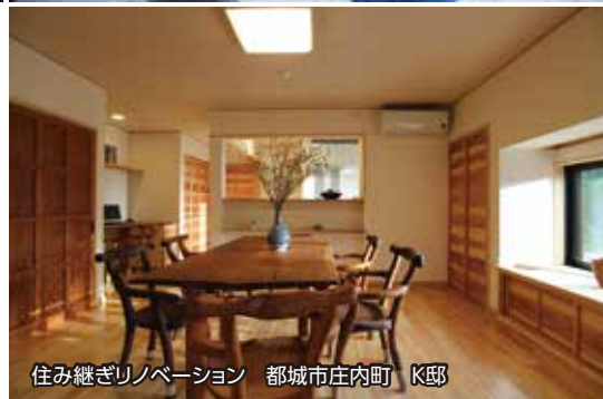
住み継ぎリノベーション 都城市庄内町 K邸