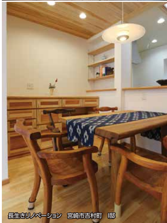
長生きリノベーション 宮崎市吉村町 邸